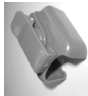
Agrafe à courroie

Pile au lithium-ion spéciale rechargeable Piles du pendentif; 2 pièces