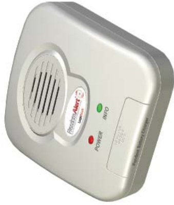
Bloc de base